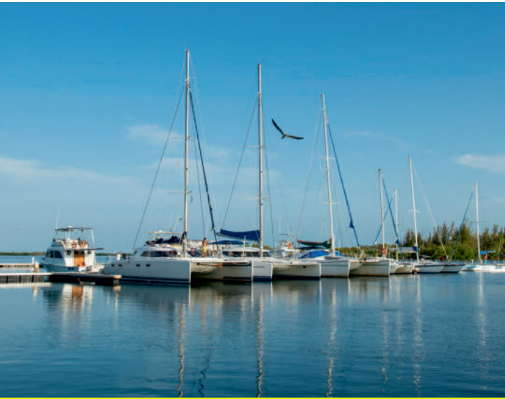
Nautique Marina Marlin Cayo Largo

Le nautique est la modalité touristique fondamentale qu'offre la destination à ses visiteurs. À cet égard, le Marlin Marina Cayo Largo inclut parmi ses offres un groupe d'activités en la mer, de grand intérêt pour les touristes. Son Centre international de la Plongée, dont le collectif possède une expérience dans la spécialité, mise à la disposition des clients, packages de plongées pour les plongeurs certifiés, des cours pour débutants en la plongée, et d'autres cours avec l'accréditation internationale (Scuba Diver, Open Water, Advanced y Rescue).