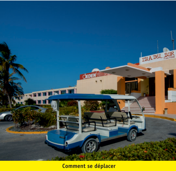
Comment se déplacer

Aéroport “Vilo Acuña” Tél.: (+53) 45-248-141