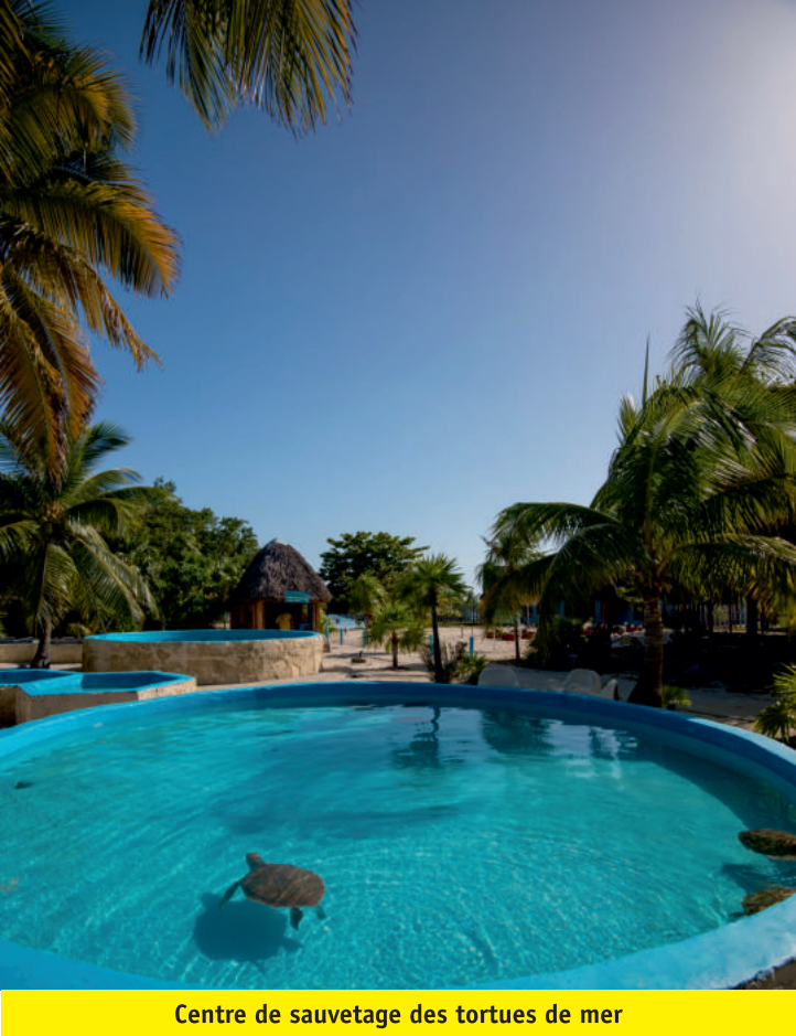
Centre de sauvetage des tortues de mer

Plage “Mal Tiempo” Si vous voulez un endroit calme pour être en contact direct avec la nature, ce havre de paix est idéal.