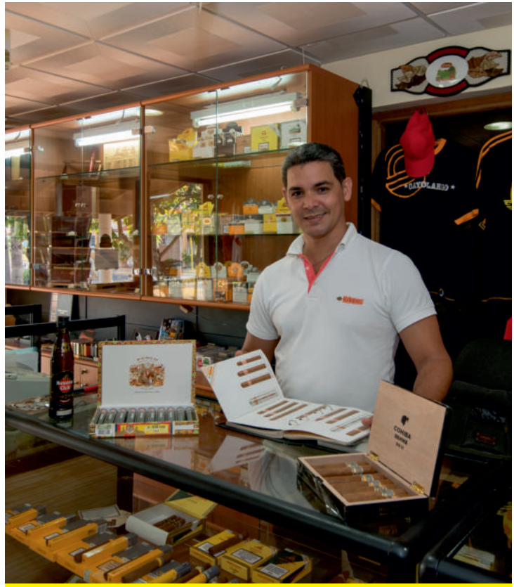
Maison du Cigare Habano

Magasin Hôtel Iberostar Playa Blanca Tel.: (+53) 45-248-121